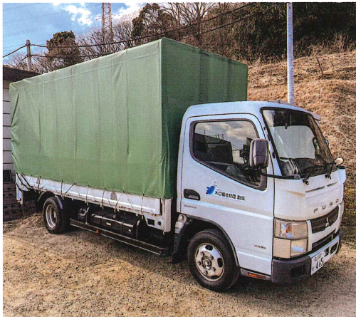
木口財団様より「トラック」