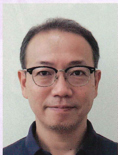
就労継続支援B型事業所 エスポアールセルプ