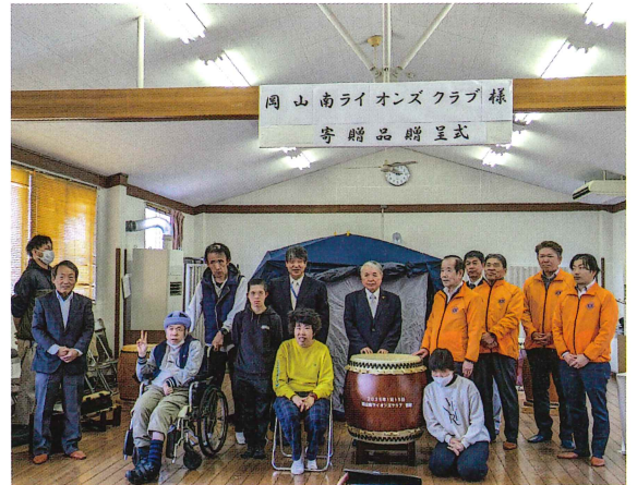
ライオンズクラブ様より「太鼓とテント」