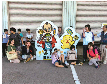
日本一のだがし売場