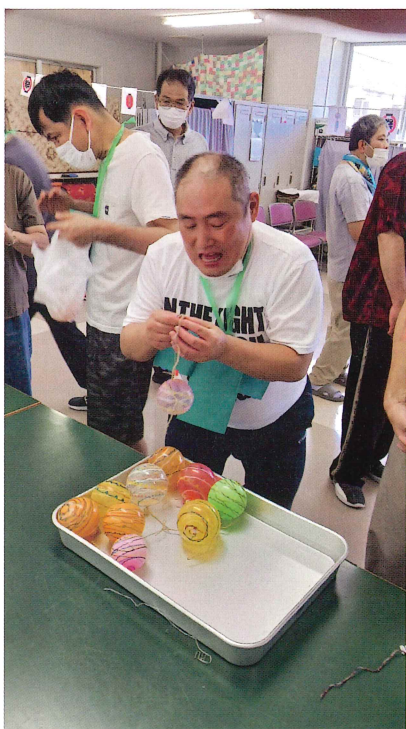
今年もとっても暑かった。。

笑顔あふれる納涼祭。みんなで夏のひとときを楽しみました! ヨーヨー釣りや創作物をみんなで作り、おやつも食べてとても楽しかったです。 定員20名、作業や療育活動を楽しくやっています。