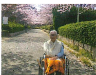
お花見 快晴で気持ち良かったです。