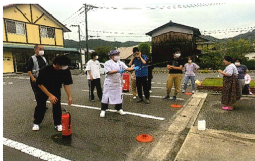
消火器を使って訓練しました。