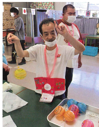
祭りといえばヨーヨー釣り!!