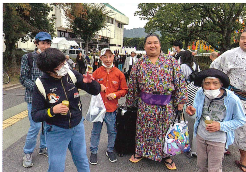
戦い終えた力士とパンチャリ