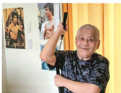
ヌンチャクの練習 周囲にきをつけてアチャー!