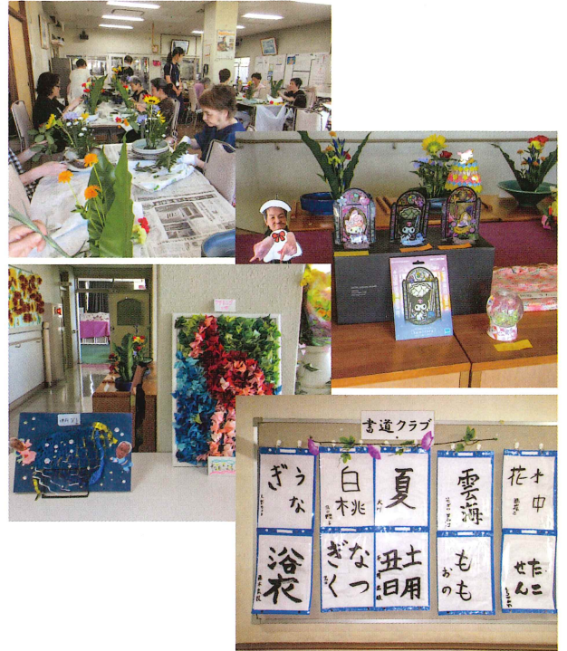
日中活動での作品集

日常生活では作品作りにも取り組んでいます。壁画や工作など、 それぞれが思い思いの作品を制作しており、他の利用者の作品を 見ることで「自分もやってみたい」という意欲につながる様子も 見られていました。クラブ活動では書道、お花、銭太鼓があり、 利用者の方々は楽しく取り組んでいます。