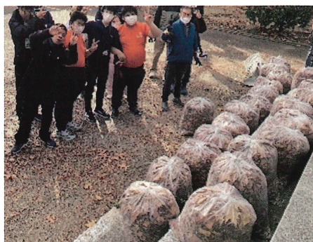
総合グラウンドの美化活動を行いました☆