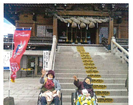
お参り 元気に過ごせますように!

生活リハビリを行うにあたり、目標が無ければ意欲が低下してしまうので、ご家族に協力を仰いで、外出する事を訓練の目標とし、近くの沖田神社に参拝しました。4家族の方が一緒に参拝して頂いて、とても喜ばれていました。