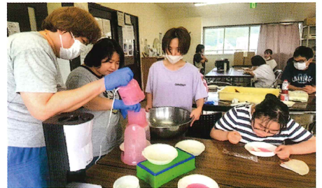
おいしいおやつ作り