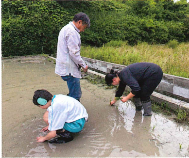
手作業でがんばりました！