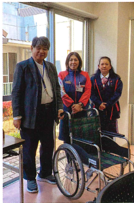
ヤクルト様より 「車椅子寄贈事業」