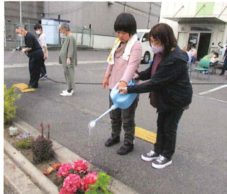
お花に水を 大きくきれいに育ちました。