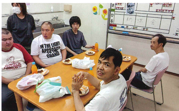
楽しさで暑さを吹き飛ばせ!!