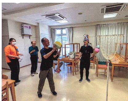
アイスマンと対決