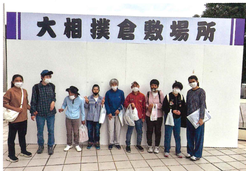
全員で集合写真 どすこい!

園では定期的に利用者のニーズに合わせて希望外出を行っています。 今回は相撲を観に行ってきました!!