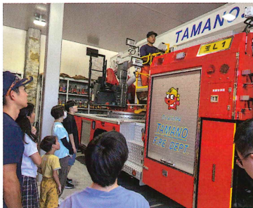
玉野市防災センター