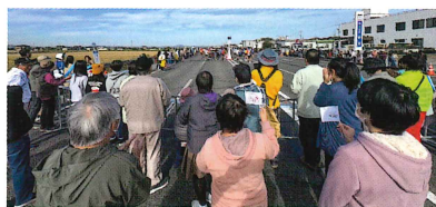
岡山マラソン見学